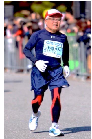
早春の都路のラン老いガンバル 2018 年 2 月京都マラソン

《追記》2018 年 11 月茨木市制 70 周年記念式典があり、多くの招待者に混じり功勞賞をうけました。表彰状など縁が無いと思っていたので、改めてボランティアを続けられたことに感謝です。