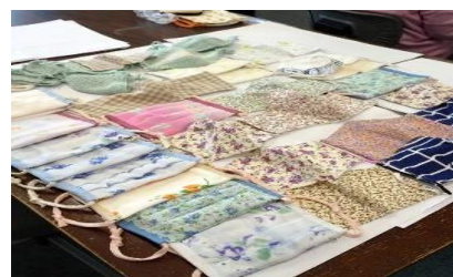
皆さんから寄せられた 手作りマスク